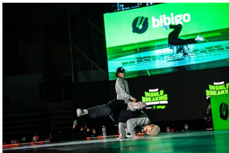
(ベスト4でのAYUMI選手の様子)