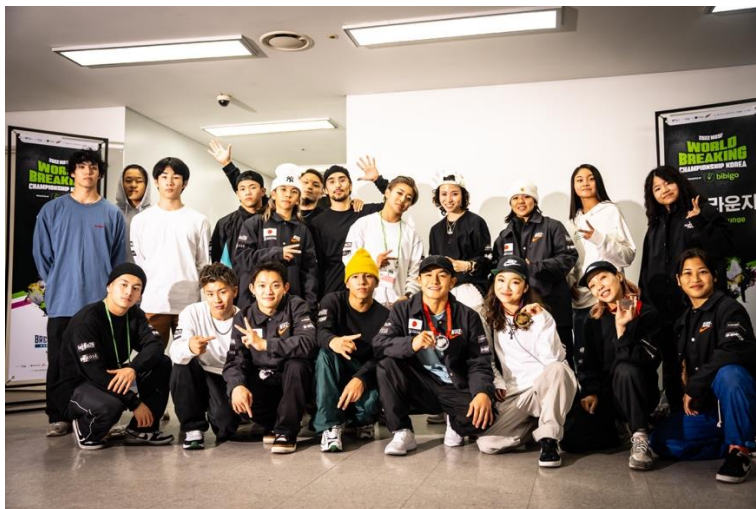
(日本人参加選手一部)