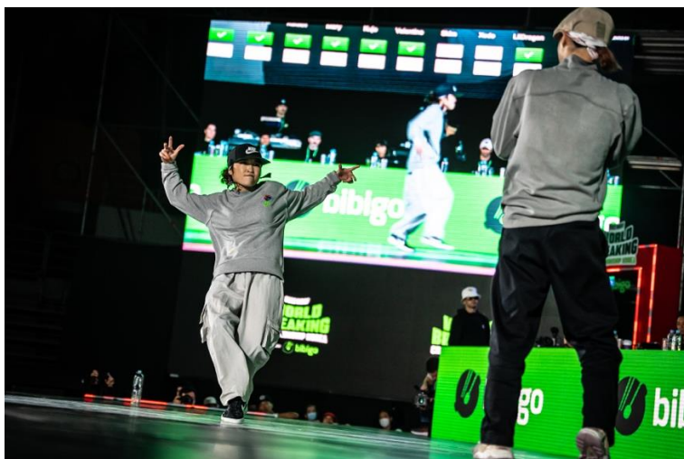
(ベスト4でのAMI選手の様子)